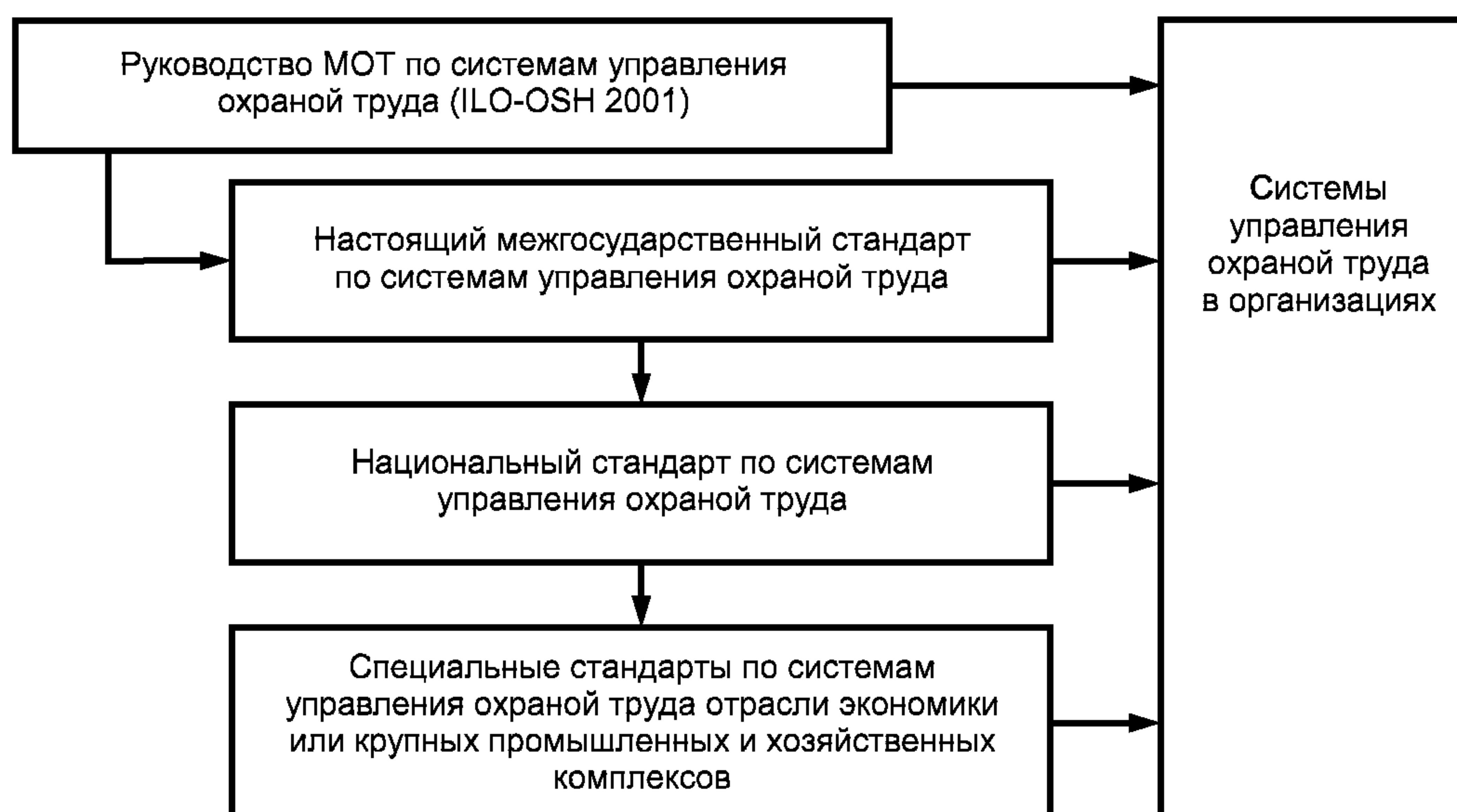
Рисунок 1 — Элементы национальных структур систем управления охраной труда

3.3.2 Элементы национальных структур управления охраной труда и связи между ними представлены на рисунке 1.